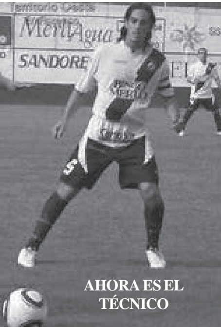
AHORA ES EL TÉCNICO