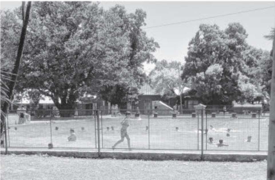
Se sigue desarrollando la temporada de pileta en las hermosas instalaciones del Remanso, el predio deportivo que se encuentra en el Parque San Martín